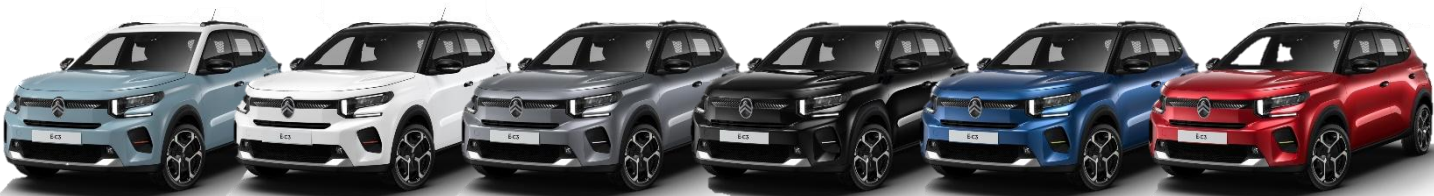
Blå Monte Carlo