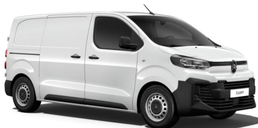
Vit Kaolin (Metallic)