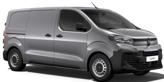
Grå Steel (Metallic)