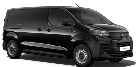
Svart Perla Nera (Metallic)